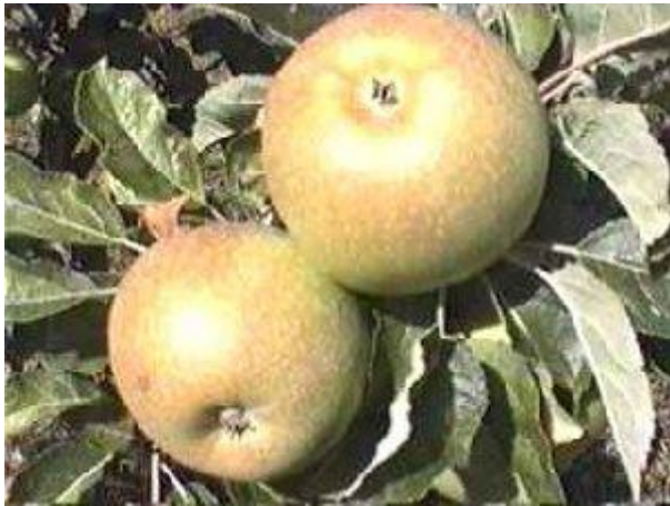
Merci Alain Rouèche ©